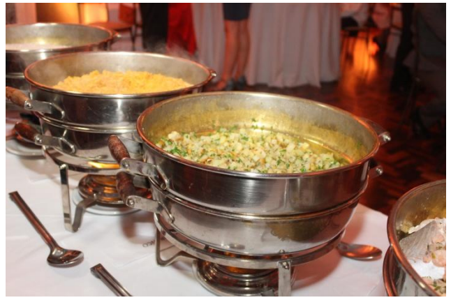
Tudo pronto e o jantar passou a ser a bola da vez.